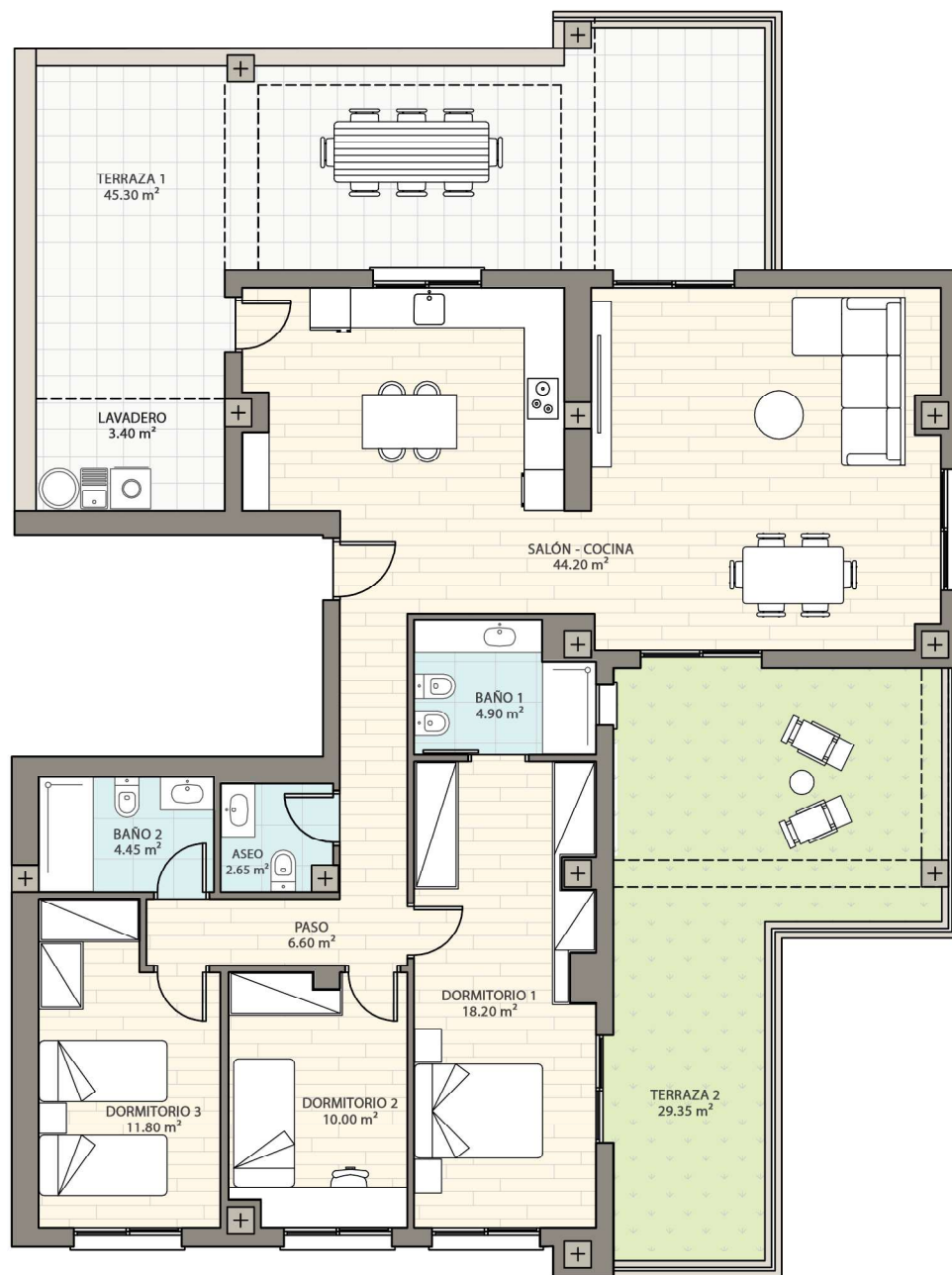
(Plano Distribución 2)