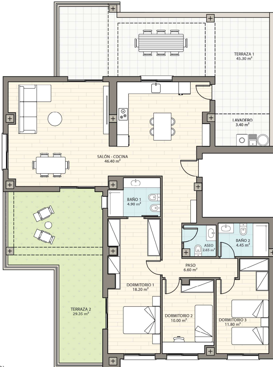
(Plano Distribución 2)